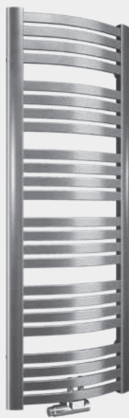
Na zdjęciu zawór: Oventop Multiblock Uniwersalny

Możliwość zamówienia we wszystkich kolorach z oferty Enix.