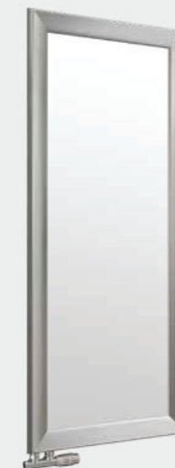
Na zdjęciu zawór: Schlosser Duoplex Prawy

Możliwość zamówienia we wszystkich kolorach z oferty Enix, bez dopłaty.