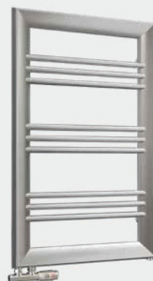
Na zdjęciu zawór: Schlosser Duoplex Prawy

Możliwość zamówienia we wszystkich kolorach z oferty Enix, bez dopłaty.