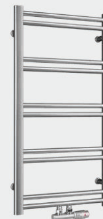
Na zdjęciu zawór: Schlosser Duoplex Prawy