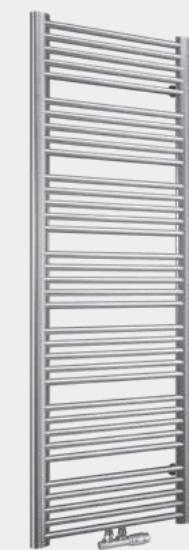
Na zdjęciu zawór: Schlosser Duoplex Prawy

Możliwość zamówienia we wszystkich kolorach z oferty Enix.